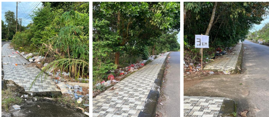
Gambar 2. Pembuangan sampah sembarangan di lingkungan desa Balunijuk

menciptakan program berkelanjutan yang mampu membawa perubahan nyata di tingkat komunitas.