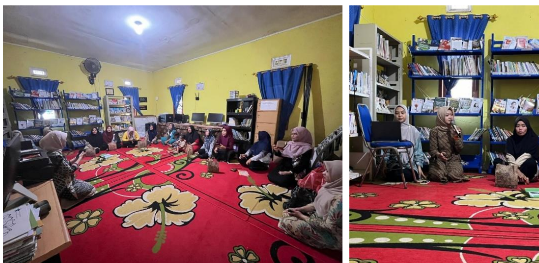
Gambar 3. Sosialisasi pengelolaan sampah rumah tangga kepada ibu-ibu PKK desa Balunijuk

Sekarningrum et al., (2024) menyatakan bahwa keterlibatan perempuan dalam pengelolaan lingkungan memiliki peran strategis dalam mengubah perilaku masyarakat. Berdasarkan hal tersebut, peran ibu rumah tangga dalam pengelolaan sampah rumah tangga sangat strategis dalam menciptakan kebiasaan baru yang berorientasi pada pelestarian lingkungan. Selain itu, pengelolaan sampah rumah tangga yang baik dapat membantu mengurangi volume sampah yang berakhir di tempat pembuangan akhir (TPA), sehingga berdampak positif pada pengurangan beban lingkungan secara keseluruhan. Oleh karena itu, program lanjutan seperti pelatihan dan praktik langsung sangat dibutuhkan agar pemahaman terhadap pengelolaan sampah rumah tangga dan perubahan perilaku ini tetap konsisten dan berkembang.