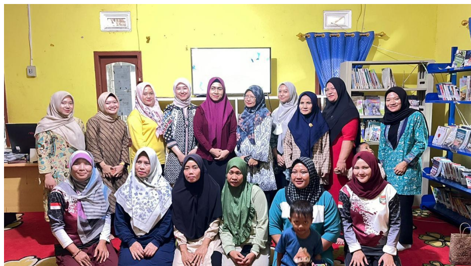
Gambar 4. Foto bersama narasumber dan peserta sosialisasi