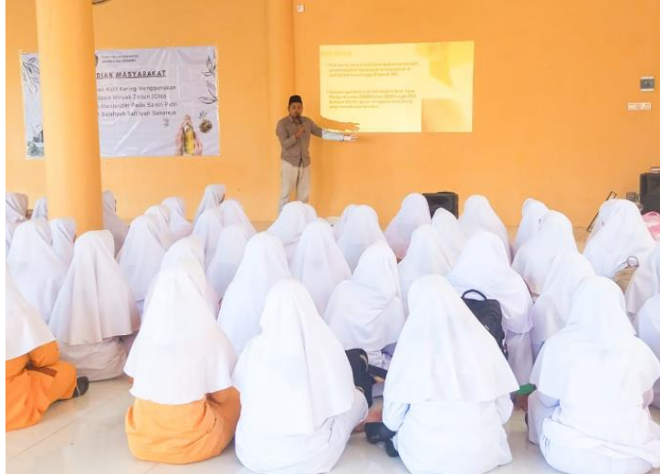
Gambar 1. Pemaparan fasilitator terkait pencegahan kulit kering menggunakan minyak zaitun terhadap santri putri pondok pesantren Salafiyah Syafiiyah Sukorejo

Peningkatan pemahaman terkait kulit kering dapat terlihat pada hasil posttest . Peningkatan tersebut terjadi karena santri putri telah diberikan pemahaman dari pemaparan fasilitator. Selain itu, pada akhir kegiatan diberikan contoh produk kosmetika yang berbasis minyak zaitun yang telah terdaftar BPOM sehingga santri putri dapat segera mengaplikasikan pengetahuan terkait pencegahan kulit kering.