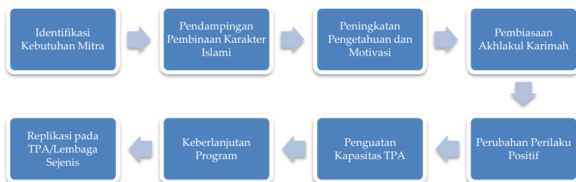
Gambar 8. Model Dampak dan Keberlanjutan Program Pendampingan Pembinaan Karakter Islami.

Pelaksanaan Program Pendampingan Pembinaan Karakter Islami memberikan dampak positif bagi TPA Jannatul Firdaus sebagai mitra pengabdian. Berdasarkan hasil evaluasi bersama pengelola TPA dan ustaz/ustazah, program ini tidak hanya meningkatkan kualitas pelaksanaan pembinaan karakter selama kegiatan berlangsung, tetapi juga memberikan alternatif model pembelajaran yang lebih interaktif, partisipatif, dan sesuai dengan karakteristik peserta didik. Pengelola TPA menyampaikan bahwa kombinasi penyampaian materi, simulasi, permainan edukatif, pembiasaan, dan pendampingan membuat proses pembelajaran menjadi lebih menarik sehingga peserta didik menunjukkan keterlibatan yang lebih tinggi dibandingkan pembelajaran yang hanya menggunakan metode ceramah. Temuan ini menunjukkan bahwa kolaborasi antara perguruan tinggi dan lembaga pendidikan masyarakat mampu memperkuat kapasitas mitra dalam mengembangkan inovasi pembelajaran yang berorientasi pada pembentukan karakter.