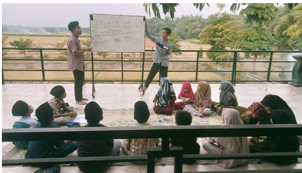
Gambar 1. Penyampaian materi mengenai nilai-nilai akhlakul karimah melalui pendekatan interaktif kepada peserta didik.

Kegiatan diawali dengan penyampaian materi mengenai pentingnya akhlakul karimah berdasarkan nilai-nilai Al-Qur'an dan hadis. Materi difokuskan pada penguatan karakter religius seperti kejujuran (ṣidq) amanah, tanggung jawab, disiplin, kepedulian, sopan santun, serta penghormatan kepada guru dan orang tua. Penyampaian materi dilakukan menggunakan bahasa yang sederhana dan disesuaikan dengan karakteristik peserta didik usia sekolah dasar sehingga mudah dipahami. Tim pengabdian juga menyampaikan kisah keteladanan Rasulullah saw, sebagai contoh konkret penerapan akhlakul karimah dalam kehidupan sehari-hari. Penyampaian materi berbasis keteladanan terbukti membantu peserta didik memahami hubungan antara konsep yang dipelajari dengan praktik nyata dalam kehidupan mereka (Lilawati et al., 2023).