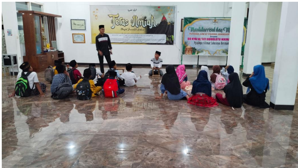
Gambar 2. Permainan edukatif berbasis karakter sebagai media penguatan motivasi dan internalisasi nilai-nilai akhlakul karimah.

pandangan teman, dan bersama-sama mencari solusi terhadap berbagai permasalahan yang mereka hadapi (Kusumadinata et al., 2024). Kegiatan diskusi seperti ini mendorong berkembangnya kemampuan berpikir kritis sekaligus memperkuat internalisasi nilai karakter melalui proses refleksi bersama.