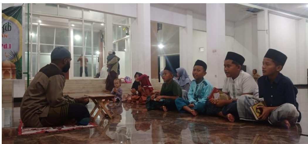
Gambar 6. Evaluasi dan Refleksi Bersama

Evaluasi program dilaksanakan untuk mengetahui efektivitas kegiatan pendampingan dalam memperkuat karakter Islami peserta didik TPA Jannatul Firdaus. Evaluasi dilakukan secara berkelanjutan selama pelaksanaan program melalui observasi langsung, penyebaran angket respons peserta, serta diskusi reflektif bersama pengelola TPA. Pendekatan evaluasi yang memadukan berbagai sumber data memungkinkan tim pengabdian memperoleh gambaran yang lebih komprehensif mengenai proses maupun hasil pelaksanaan kegiatan (Kania et al., 2024). Selain menilai tingkat ketercapaian tujuan program, evaluasi juga menjadi dasar dalam menyusun rekomendasi untuk keberlanjutan pembinaan karakter di lingkungan TPA.