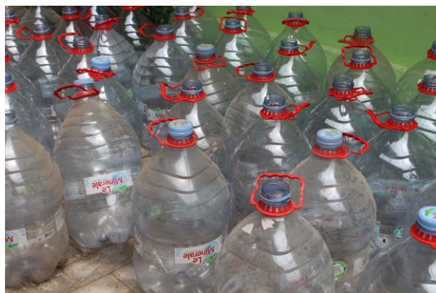
Gambar 1. Galon bekas air mineral

Pelaksanaan kegiatan pengabdian yaitu sosialisasi sampah inorganik dan sosialisasi pemanfaatan botol bekas sebagai wadah tanam dilakukan pada tanggal 5 November 2023. Kegiatan ini dihadiri oleh 29 anak panti dan satu orang pembina panti sebagai perwakilan pihak panti. Kegiatan berlangsung dari jam 8 – 12 WIB. Pada kesempatan ini, Dr. Santhyami, M.Si selaku pengabdian memberikan sosialisasi terkait apa itu sampah inorganik, bahayanya pada lingkungan dan manfaatnya apabila dilakukan pengolahan lebih lanjut. Setelah itu kegiatan dilanjutkan dengan tanya jawab. Sebanyak dua orang anak bertanya terkait berbagai jenis sampah inorganik dan pemanfaatannya selain dijadikan media tanam yang menjadi tema utama kegiatan pengabdian ini.