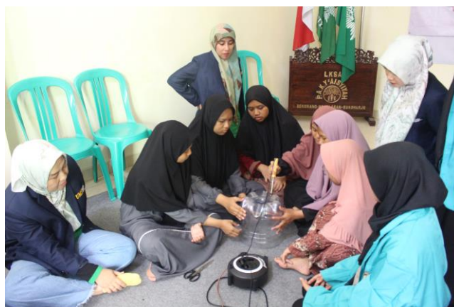
Gambar 3. Simulasi pembuatan media tanam dari galon oleh anak panti

Setelah dilakukan sosialisasi pembuatan media tanam, anak panti diminta membuat 6 kelompok dengan masing-masing anggota 4-5 orang. Setiap kelompok diberikan kesempatan untuk simulasi pembuatan media tanam. (Gambar 3) dan selanjutnya melanjutkan kegiatan sampai media tanam siap untuk digunakan. Setiap kelompok mendapatkan 15 galon bekas, sehingga total media tanam yang siap untuk digunakan dari hasil kegiatan ini berjumlah sebanyak 90 buah.