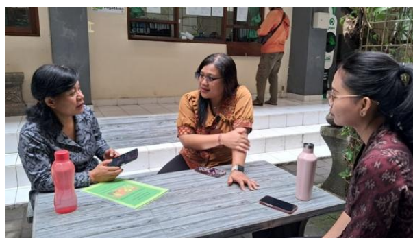
Gambar 2. Tim pelaksana PkM dan guru Bahasa Inggris berdiskusi

Selanjutnya, sesuai dengan jadwal pelaksanaan pendampingan yang sudah disepakati oleh tim pelaksana dengan guru bahasa Inggris, pendampingan dilaksanakan di dalam kelas. Tim pelaksana PkM mengamati pelaksanaan pembelajaran berdiferensiasi oleh guru Bahasa Inggris dari kegiatan awal, kegiatan inti hingga kegiatan penutup. Pada kegiatan awal, tim pelaksana PkM mencermati bagaimana guru bahasa Inggris membangun suasana kelas yang kondusif, memberikan apersepsi, menyampaikan tujuan pembelajaran kepada siswa dan penilaian diagnosis.