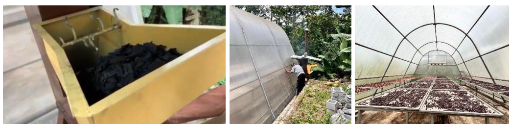
Gambar 4. Penerapan Teknologi Pengeringan Rocket Stove-Solar Dome

Teknologi Rocket Stove-Solar Dome yang diterapkan pada kegiatan ini merupakan sistem pengering terintegrasi yang memanfaatkan kombinasi energi panas matahari dan sumber panas tambahan berbasis biomassa. Sistem solar dome atau green house berfungsi menangkap dan mempertahankan panas matahari di dalam ruang pengering. Rocket stove menggunakan biomassa lokal berupa tempurung kelapa dan bambu sebagai bahan bakar utama. Pemanfaatan biomassa lokal dipilih karena mudah diperoleh masyarakat, memiliki biaya operasional rendah, dan mendukung penggunaan energi yang lebih ramah lingkungan. Selain itu, penggunaan biomassa juga menjadi solusi pemanfaatan limbah pertanian dan perkebunan yang sebelumnya belum dimanfaatkan secara optimal. Pada tahap penerapan teknologi (Gambar 4), kelompok tani dilibatkan secara langsung dalam proses pengoperasian alat mulai dari persiapan bahan baku kopi dan kakao, pengaturan bahan bakar biomassa, pengontrolan suhu, hingga pemantauan proses pengeringan. Kegiatan praktik dilakukan secara bertahap agar peserta dapat memahami prosedur penggunaan alat secara menyeluruh.