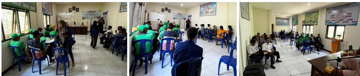
Gambar 2. Kegiatan Sosialisasi dan Pelatihan

Sebelum kegiatan pengabdian dilaksanakan, sebagian besar anggota kelompok tani masih memiliki keterbatasan pengetahuan mengenai teknologi pengering berbasis biomassa. Proses pengeringan selama ini dilakukan secara tradisional dengan penjemuran langsung di bawah sinar matahari tanpa pengendalian suhu dan kelembapan. Kondisi tersebut menyebabkan masyarakat belum memahami pentingnya pengontrolan proses pengeringan terhadap mutu hasil perkebunan. Melalui kegiatan sosialisasi dan pelatihan (Gambar 2), peserta diberikan pemahaman mengenai prinsip kerja teknologi Rocket Stove–Solar Dome, jenis biomassa yang dapat digunakan sebagai bahan bakar alternatif, teknik pengoperasian alat, pengaturan suhu dan kelembapan, serta prosedur perawatan alat pengering. Materi disampaikan secara interaktif melalui ceramah, diskusi, dan praktik langsung sehingga peserta lebih mudah memahami konsep dan cara penggunaan teknologi.