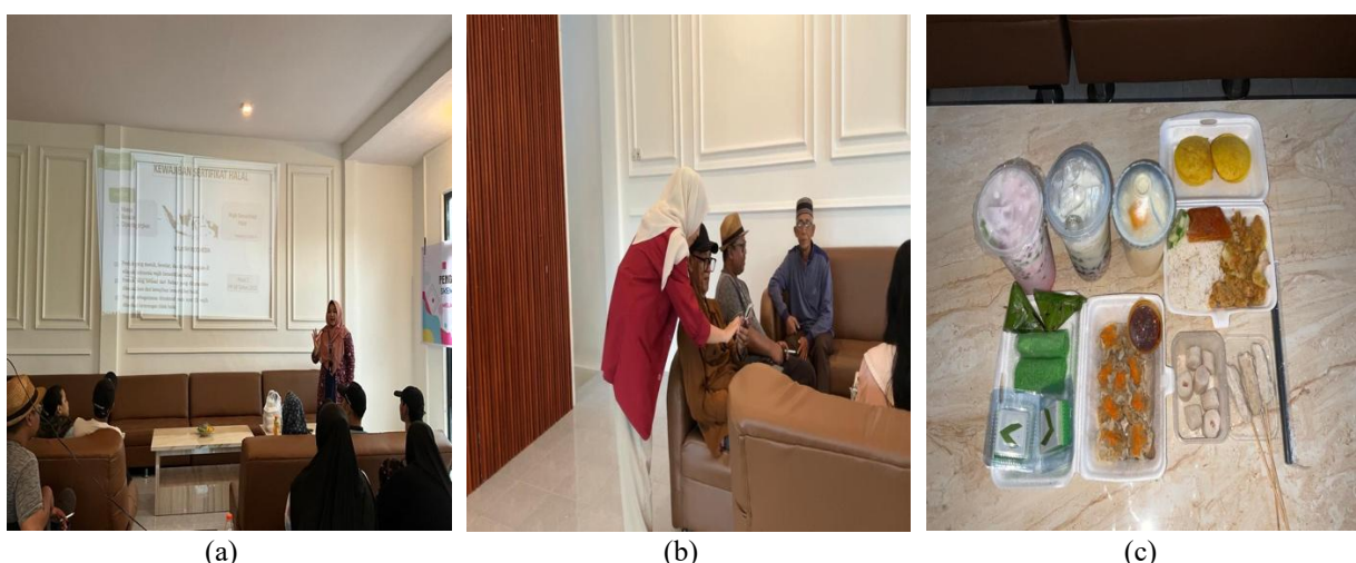
Gambar 1. Edukasi Sertifikasi Halal (a) Pelatihan Aplikasi SIHALAL (b) dan Produk UMKM (c)

Secara kritis, hasil kegiatan ini sejalan dengan berbagai temuan dalam literatur yang menunjukkan bahwa edukasi berperan dalam meningkatkan pengetahuan dan sikap UMKM, pendampingan meningkatkan keberhasilan implementasi, serta literasi digital menjadi faktor kunci dalam adopsi teknologi, dengan keunggulan utama program ini terletak pada integrasi ketiga aspek tersebut secara simultan dalam satu intervensi (Arjang et al., 2025; Suryawan et al., 2026).