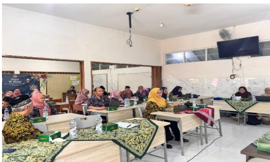
Gambar 4. Diskusi dan tanya jawab