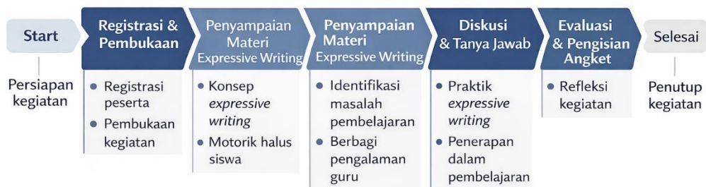
Gambar 1. Alur Pelaksanaan Kegiatan

Alur pelaksanaan kegiatan dimulai dari tahap registrasi dan pembukaan yang bertujuan untuk mengondisikan peserta serta memberikan pengantar kegiatan. Selanjutnya, kegiatan dilanjutkan dengan penyampaian materi mengenai teknik expressive writing sebagai pendekatan dalam pengembangan motorik halus siswa. Pada tahap ini, peserta memperoleh pemahaman konseptual melalui metode ceramah. Tahap berikutnya adalah diskusi dan tanya jawab, yang bertujuan untuk menggali pengalaman serta permasalahan yang dihadapi guru dalam pembelajaran, khususnya terkait pengembangan motorik halus siswa berkebutuhan khusus. Setelah itu, kegiatan dilanjutkan dengan praktik dan sosialisasi, di mana peserta secara langsung menerapkan teknik expressive writing berbasis model handwriting . Tahap terakhir adalah evaluasi dan pengisian angket. Pada tahap ini, peserta memberikan umpan balik terhadap kegiatan yang telah dilaksanakan, sehingga dapat diketahui keberhasilan pelaksanaan workshop serta sebagai bahan perbaikan untuk kegiatan selanjutnya.