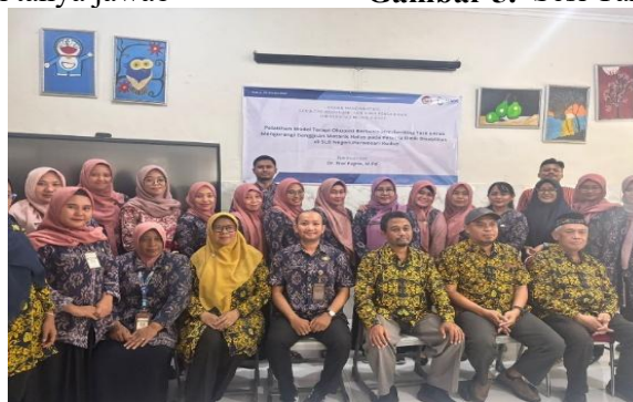
Gambar 6. Foto Bersama Tim PkM dan Mitra