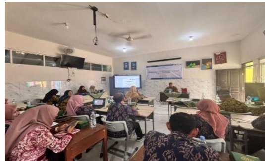
Gambar 3. Penyampaian materi oleh tim