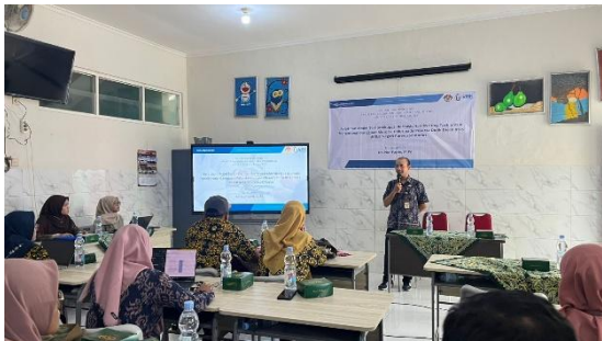
Gambar 2. Penyampaian Sambutan oleh Mitra

Selama kegiatan berlangsung, peserta workshop (guru-guru SLB Purwosari Kudus) menunjukkan keterlibatan aktif dalam praktik dan diskusi. Guru mampu memahami bahwa integrasi antara teknik expressive writing berbasis model handwriting tidak hanya membantu meningkatkan kemampuan menulis, tetapi juga memberikan dampak positif terhadap perkembangan motorik halus, kemandirian belajar, serta aspek emosional siswa. Berikut tersaji beberapa dokumentasi kegiatan.