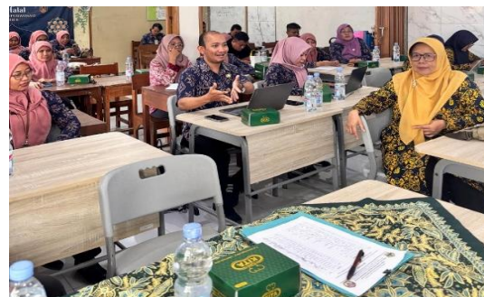
Gambar 5. Sesi Tanya Jawab Peserta