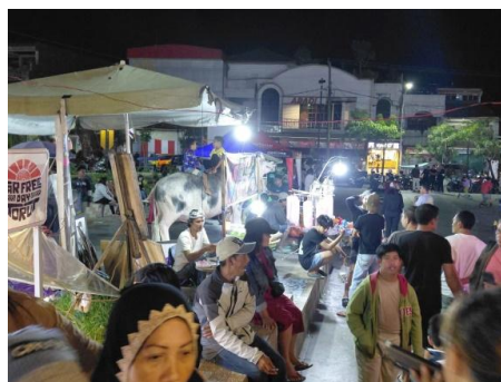
Gambar 4. Presentasi Peserta dalam Kompetisi Bisnis Kreatif

Kompetisi bisnis kreatif diselenggarakan untuk menilai inovasi, kreativitas, dan strategi pemasaran peserta secara komprehensif. Kegiatan ini membantu peserta mengidentifikasi kelebihan dan kekurangan usahanya, sekaligus menjadi motivasi untuk meningkatkan kualitas produk dan strategi bisnis. Dengan demikian, kompetisi ini mendorong terciptanya semangat inovasi dan daya saing usaha yang lebih tinggi.