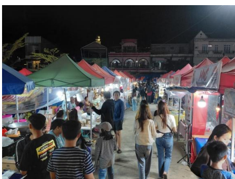
Gambar 2. Pelaksanaan Workshop Digital Marketing untuk Peningkatan Promosi Usaha