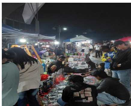
Gambar 1. Kegiatan Pelatihan Kewirausahaan bagi Peserta EBF

Pada tahap pelatihan, peserta dibekali materi kewirausahaan yang mencakup pengembangan ide bisnis, pengelolaan usaha, serta strategi pemasaran. Selain itu, workshop digital marketing diberikan untuk meningkatkan kemampuan peserta dalam memanfaatkan media sosial, marketplace, dan teknik branding digital.