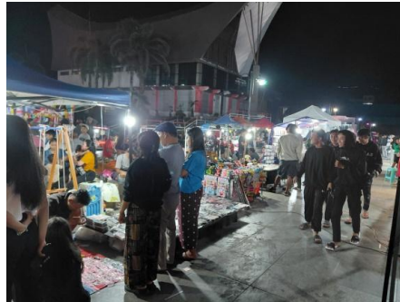
Gambar 3. Stand Pameran Produk UKM pada Kegiatan Economic Business Fair (EBF)

Kegiatan pameran produk (business fair) merupakan inti dari rangkaian kegiatan, di mana peserta memamerkan dan menjual produk secara langsung kepada pengunjung. Melalui kegiatan ini, peserta memperoleh pengalaman nyata dalam promosi, interaksi dengan konsumen, dan transaksi penjualan, serta memahami preferensi pasar dan efektivitas strategi pemasaran. Dengan demikian, pameran ini tidak hanya berfungsi sebagai media promosi, tetapi juga sebagai sarana pembelajaran berbasis pengalaman.