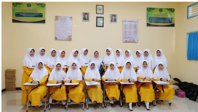
Gambar 3. Foto bersama mitra