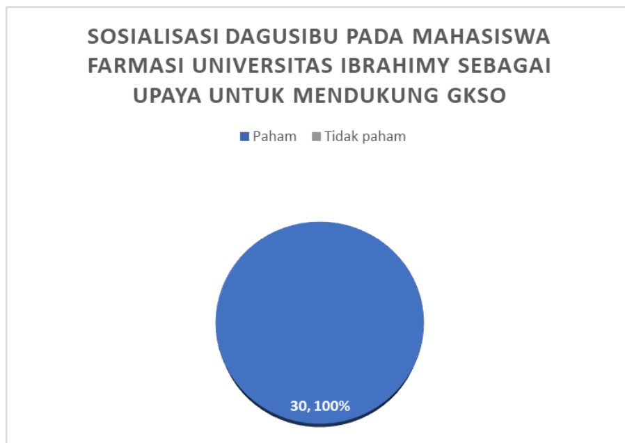
Gambar 5. Hasil Posttest Pemahaman Dagubisu

Hasil rekapitan kuesioner posttest kegiatan pengabdian masyarakat setelah mendapatkan sosialisasi mengenai dagusibu yaitu menunjukkan bahwa semua mitra mengerti setelah mendapatkan sosialisasi tentang dagusibu. Hal ini ditunjukkan dengan hasil posttest pada gambar 5 dimana 30 mitra memahami setelah sosialisasi(100%).