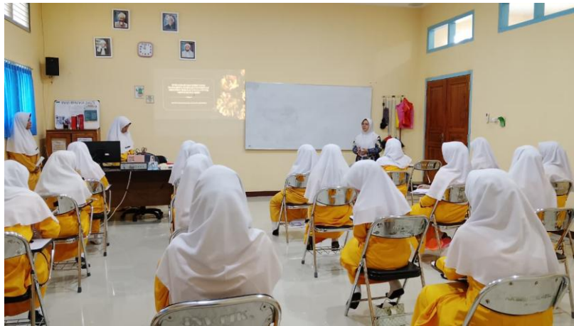
Gambar 2. Pemaparan materi dagusibu