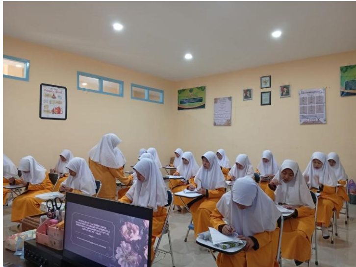
Gambar 1. Mitra mengerjakan pretest