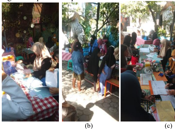
Gambar 2. Dokumentasi Kegiatan (a) Proses Registrasi Peserta (b) Pemaparan Materi Cara Pembuatan Eco-enzyme (c) Pengisian Kuesioner Dibantu Kader Posyandu

Kegiatan penyuluhan dilaksanakan pada tanggal 17 Februari 2025 bertempat di Posyandu Anggur Krajan Utara RT 02 / RW 03 Situbondo. Susunan kegiatan dimulai dari registrasi peserta kemudian pengenalan tim penyuluhan yang terdiri dari Dosen S1 Farmasi Universitas Ibrahimy. Pengisian pretest mengenai eco-enzyme dan cara pembuatannya dilaksanakan sebelum agenda penyampaian materi melalui presentasi selama 30 menit dengan metode ceramah selagi pemeriksaan posyandu berjalan. Kegiatan selanjutnya adalah penutupan dengan pengisian posttest serta dokumentasi foto bersama. Adapun dokumentasi kegiatan dapat dilihat pada Gambar 2.