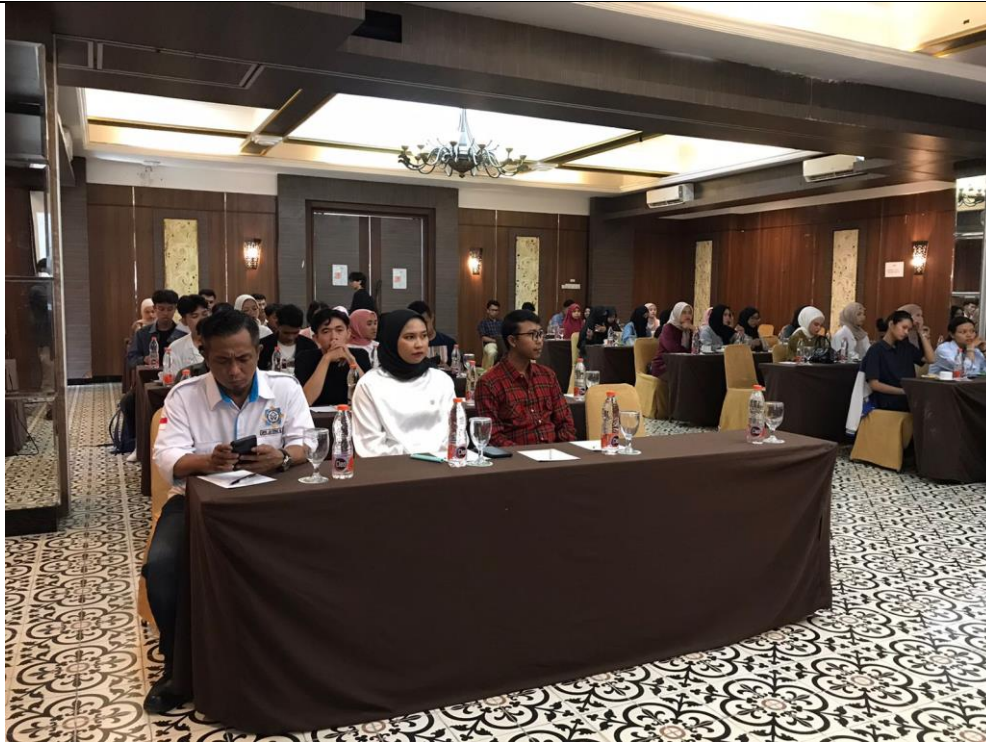
Gambar 7. Dokumentasi Peserta Kegiatan