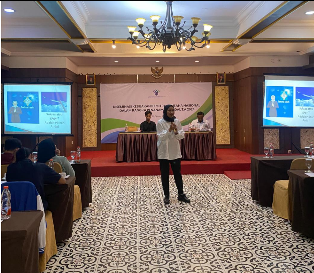
Gambar 2. Penyampaian materi Investasi