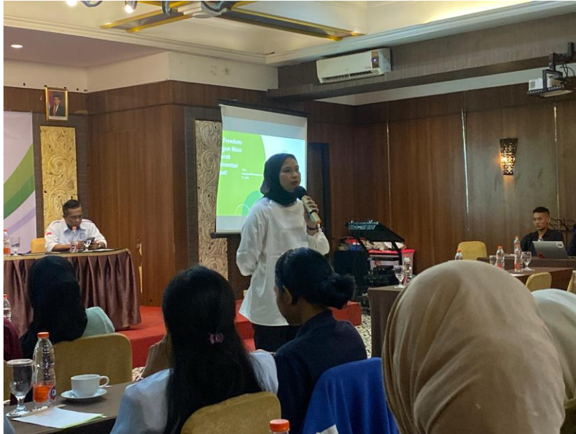
Gambar 3. Diskusi dengan peserta dan pembahasan Studi Kasus

Pada akhir simulasi, fasilitator memberikan umpan balik atas strategi yang digunakan oleh peserta, sehingga mereka dapat memahami kelebihan dan kekurangan dari keputusan yang diambil. Kegiatan ini berhasil membangun kepercayaan diri peserta dalam menghadapi dunia investasi nyata serta memotivasi mereka untuk menerapkan pengetahuan ini dalam pengelolaan keuangan pribadi.