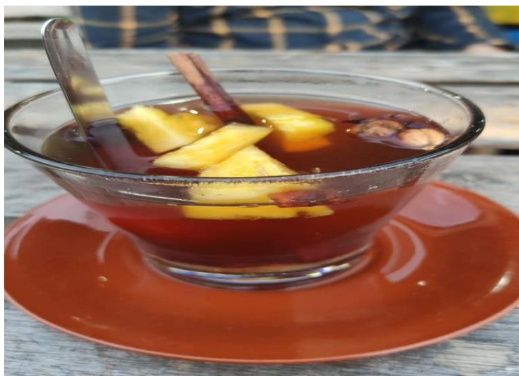
Gambar 4 Hasil Pembuatan Minuman Herbal Siap Minum

Ibu Rosnaini (67 tahun), yang merupakan lansia binaan LKS-LU Payung Besurek menyatakan senang bergabung dalam kegiatan pelayanan sosial di LKS LU Payung Besurek: “Selain mendapatkan bimbingan keagamaan, fasilitas kesehatan kami juga mendapatkan pelatihan. Kami sangat berharap pelatihan ini dapat didukung oleh banyak pihak demi mendukung lansia sehat lansia bahagia”