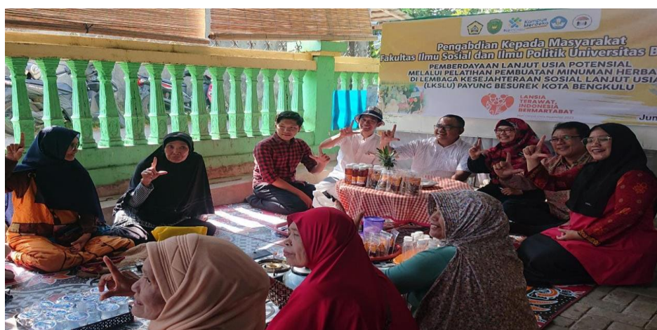
Gambar 1. Pelaksanaan Pelatihan Pembuatan Minuman Herbal

Kegiatan pengabdian kepada masyarakat ini merupakan wujud tindak lanjut Perjanjian Kerja Sama ( implementation agreement ) antara Fakultas Ilmu Sosial dan Politik Universitas Bengkulu dengan Kecamatan Ratu Agung Kota Bengkulu. Pemerintah Indonesia telah menetapkan setiap tanggal 29 Mei sebagai Hari Lanjut Usia Nasional. Pada tahun 2023 ini, peringatan HLUN mengusung tema “ Lansia Terawat Indonesia Bermartabat ”. Lanjut Usia (Lansia), merupakan masa perkembangan manusia yang disertai dengan berbagai permasalahan dan kerentanan baik berupa menurunnya kesehatan, meningkatnya masalah psikis, renggangnya relasi sosial, dan lemahnya kehidupan ekonomi. Berdasarkan Undang-Undang Nomor 13 Tahun 1998, lansia diartikan sebagai warga yang berumur 60 tahun ke atas.