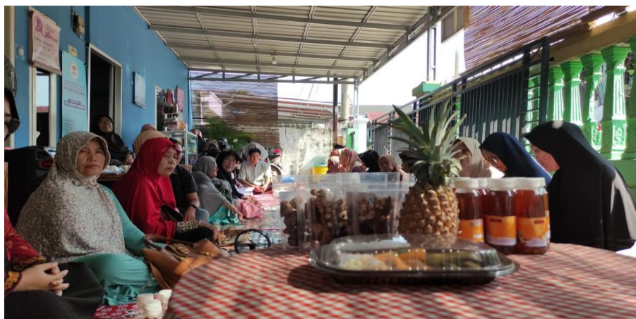
Gambar 2 Para Lansia Potensial Binaan LKS-LU Payung Besurek Bersiap Menerima Pelatihan Pembuatan Minuman Herbal

Diharapkan kegiatan ini bisa terus berlanjut menjadi usaha ekonomi produktif bagi lansia”